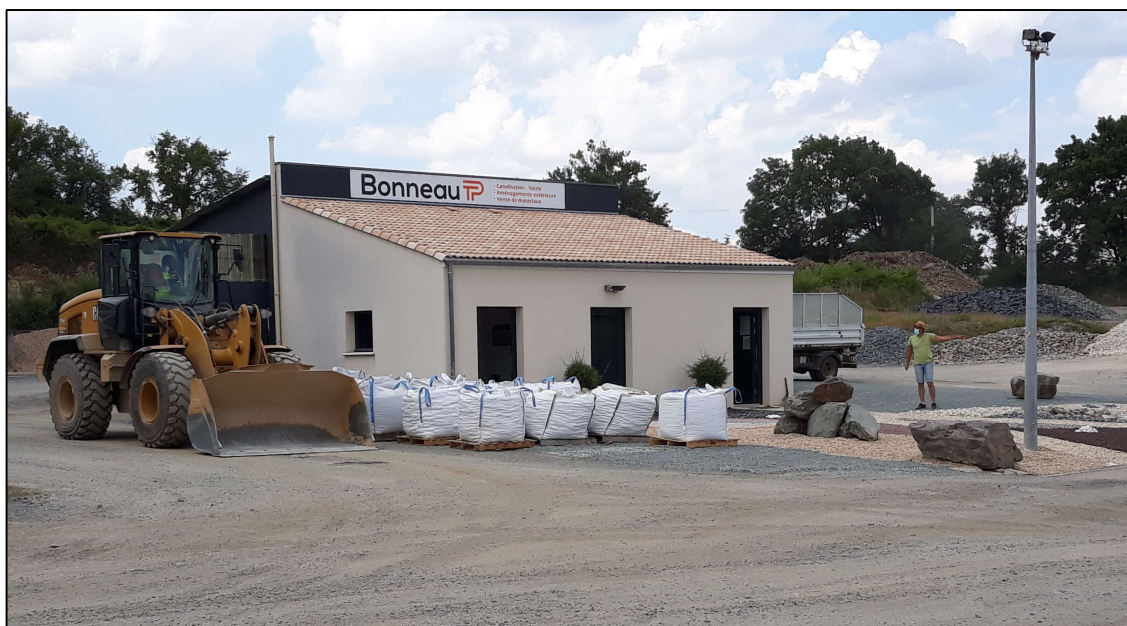
Photo 18.: Vue sur les aménagements aux abords du local administratif et pont-bascule.

↳ Nous soulignerons également que le secteur est marqué par la présence d'une seconde carrière beaucoup plus importante que celle de la Pleige à environ 500 m du site. Il s'agit de la carrière des Rochards exploitée par CMGO. Actuellement, cette dernière n'est plus en activité. Au demeurant ce site reste relativement bien discret sur la rive gauche de l'Egray.